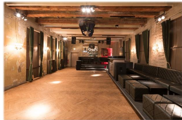
Ballroom - Party