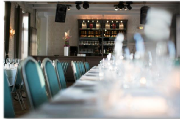
Ballroom - Dinner

Das Set-up ist komplett variabel und wird für jede Veranstaltung individuell angepasst.