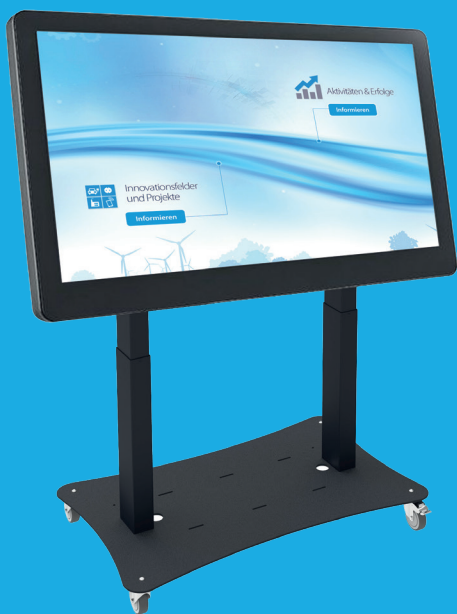
43" E-Table Light ab 5.706 €

Gibt es gleich passende Hardware zum touchwert® creator?