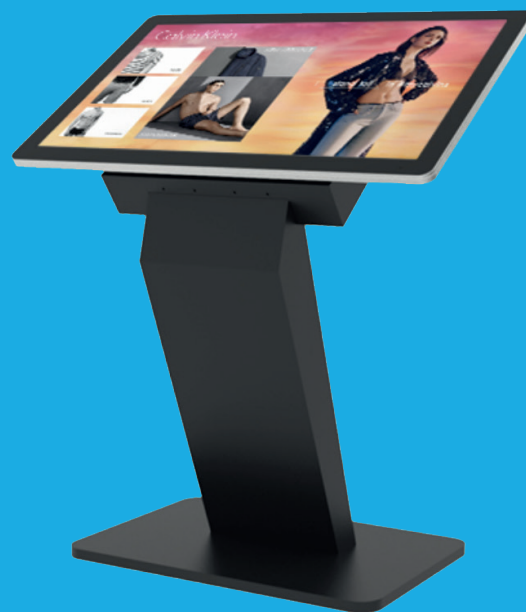
32" Terminal Flex ab 3.391 €